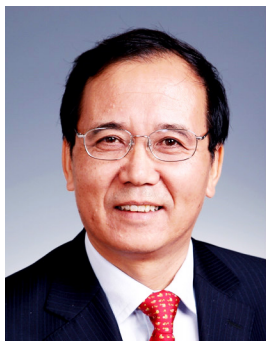
林建华 北京大学校长